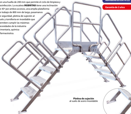
Pletina de sujeción al suelo de acero inoxidable