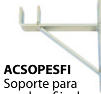
ACSOPESFI Soporte para escalera fija de pared