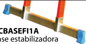
ACBASEFI1A Base estabilizadora horizontal escalera simple fibra

ACCON58 Taco escalera fibra simple, interno 58 x 25 mm.