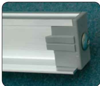
Tope de guía corredera.