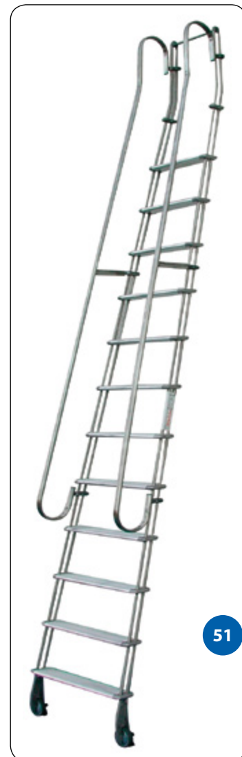
Corremanos de la escalera corredera.