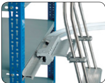
Trolley de enganche corredizo en su guía.