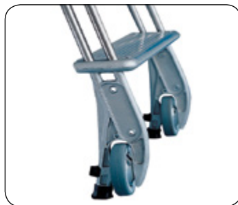
Ruedas y tacos de apoyo de la escalera corredera.