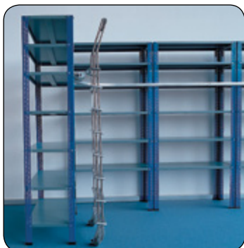
Escalera corrediza con guía y posibilidad de hacer curvas hasta de 90°.