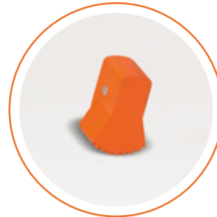
ACCONBASEFIR-T Contera base naranja