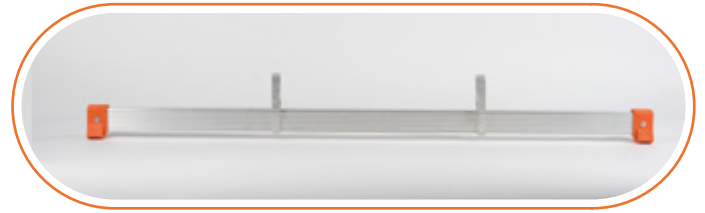
ACESTAFIJO DEL Estabilizador fijo delantero ACESTAFIJO TRA Estabilizador fijo trasero con ruedas