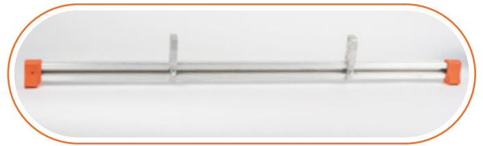
ACESTADEL Estabilizador telescópico