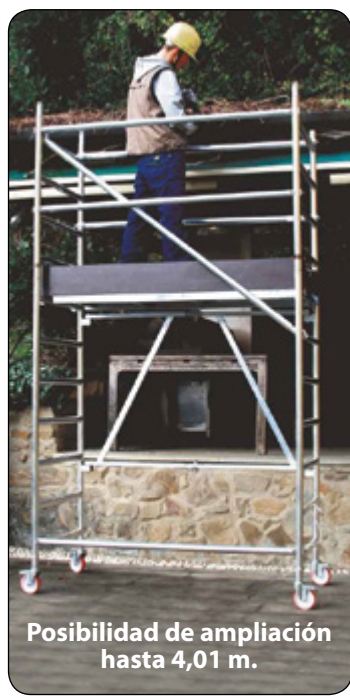
Posibilidad de ampliación hasta 4,01 m.