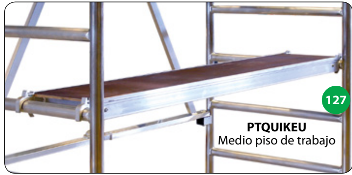
PTQUIKEU Medio piso de trabajo