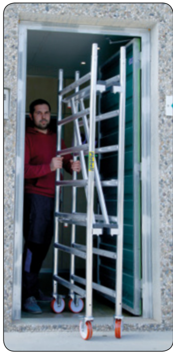
Mini andamio plegado.