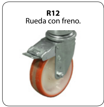
R12 Rueda con freno.