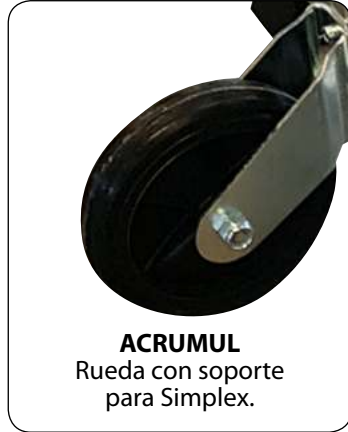
ACRUMUL Rueda con soporte para Simplex.