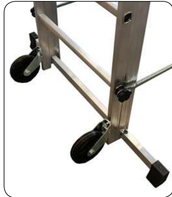
Ruedas Ruedas para su transporte en formato carro.

El andamio Simplex de la familia semiprofesional permite regular el piso de trabajo en diferentes alturas, desde una altura mínima de 1 m. hasta una altura máxima de 1,70 m., pudiéndose regular cada 28 cm. Su versatilidad y ligereza lo convierten en instrumento polivalente para trabajar con facilidad, rapidez y eficiencia en el interior de los locales, o sobre superficies que se necesite recorrer grandes distancias en poco tiempo. Las uniones de los montantes utilizan un dispositivo de anclaje de seguridad que permiten un montaje rápido de la estructura y un uso seguro.